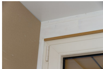
Stap 6: smal mdf latje onder stelkozijn bevestigen (kan met lijm).