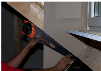
Stap 4: schuin zagen in lijn met schuine balk.