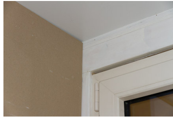
Stap 5: gipsplaat goed in hoeken vastschroeven.