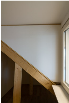
Stap 1: De casco wang.