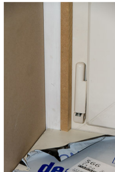
Stap 8: Hoekje vensterbank uitzagen en dan bevestigen (met lijm of schroef vanonder).