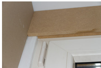
Stap 7: breedste mdf lat vastspijkeren over smalle latje heen.