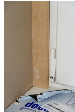
Stap 10: breedere mdf latje vastspijkeren op stelkozijn. Deze staat op de vensterbank.