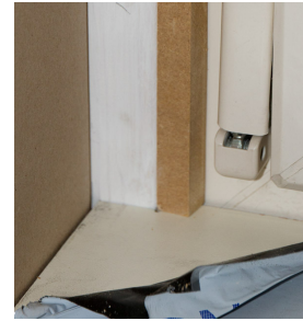
Stap 9: smalle mdf latje tegen zijkant stelkozijn plaatsen. Dit latje staat op de vensterbank.