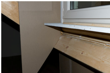
Stap 3: schuin zagen op balk (kan bij u anders zijn, bv. knieschot).